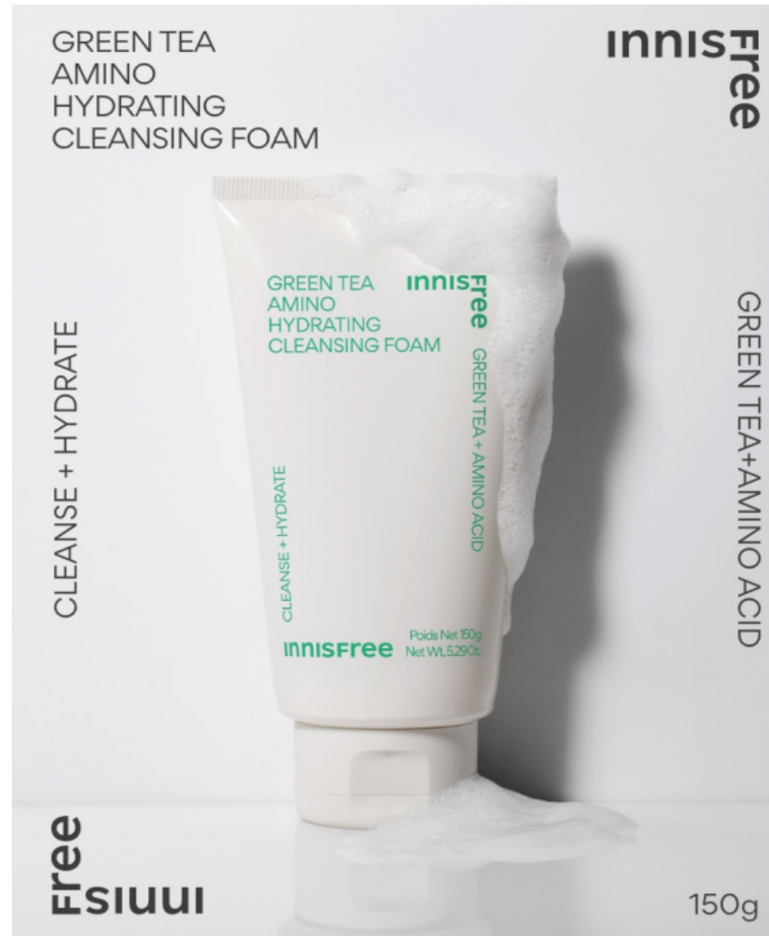
이니스프리 그린티 아미노 수분 클렌징 폼 250ml 가격: 19,000원