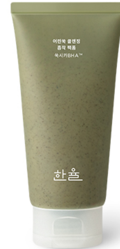
한울 어린속 진정 마스크팩 120ml 가격: 25,000원