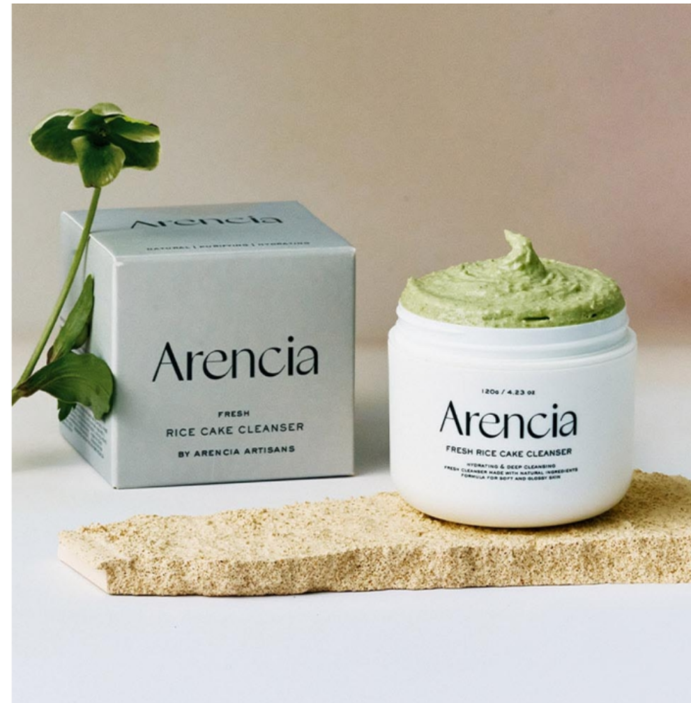
떡솅 클렌저 120ml 가격 : 23,000원